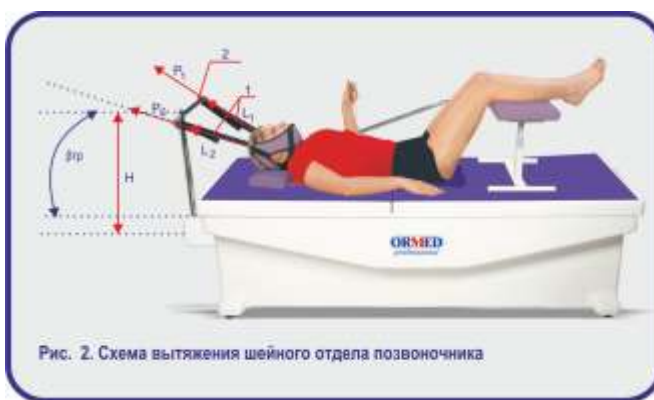
Рис. 2. Схема вытяжения шейного отдела позвоночника